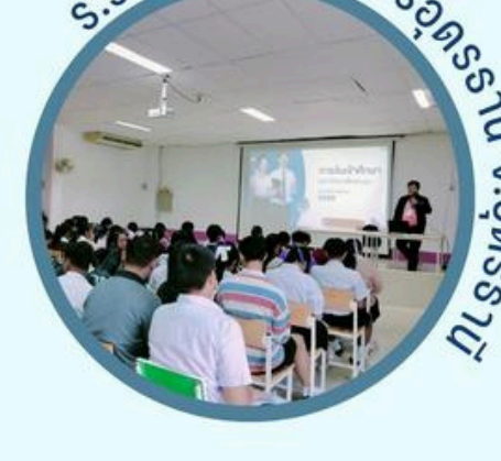
ร.ร.เทศบาล 6 นครอุดรธานี จ.อุดรธานี