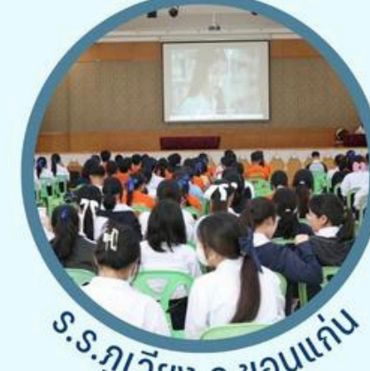
ร.ร.ภูเวียง จ.ขอนแก่น