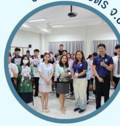
ร.ร.กัลยาณมิตร จ.ขอนแก่น