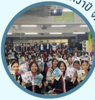
ร.ร.สกลทวาปี จ.สกลนคร