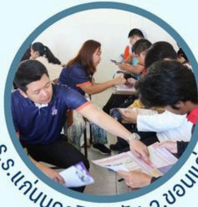
ร.ร.แก่นนครวิทยาลัย จ.ขอนแก่น