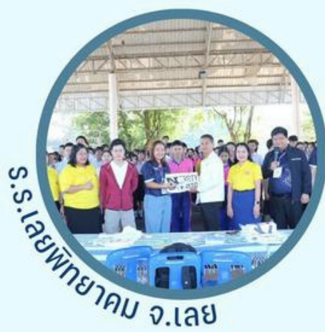
ร.ร.โขมบฏยาคม จ.เลย

คณะสาธารณสุขศาสตร์ ดำเนินโครงการแนะแนวการศึกษาต่อและเปิดประตูสู่คณะสาธารณสุขศาสตร์ (PH'UP Open House) ระหว่างวันที่ 18 - 22 พฤศจิกายน 2567 ณ พื้นที่ จ.เลย จ.หนองบัวลำภู จ.ขอนแก่น จ.อุดรธานี และ จ.สกลนคร