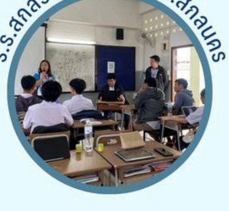
ร.ร.สกลราชวิทยานุกูล จ.สกลนคร