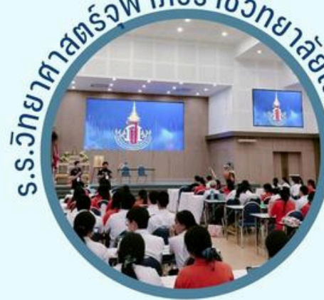
ร.ร.วิทยาลัยการราชภัฏจ.เลย