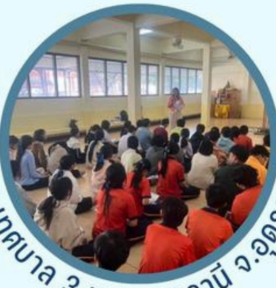
ร.ร.เทศบาล 3 นครอุดรธานี จ.อุดรธานี