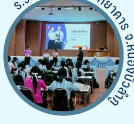
ร.ร.ศรีบุญเรืองพิทยาคาร จ.หนองบัวลำภู