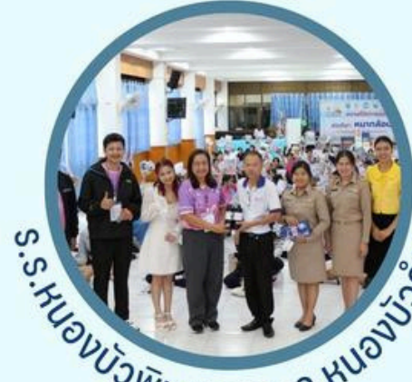
ร.ร.หนองบัวลำภู