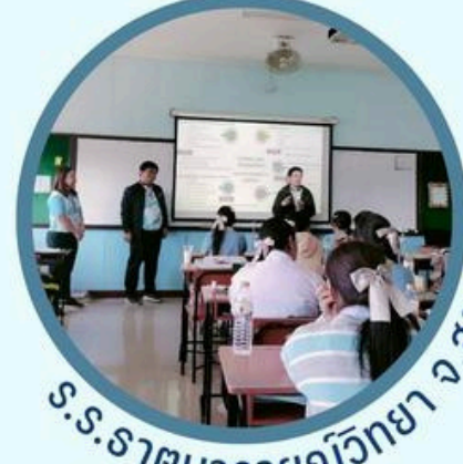
ร.ร.รัตนารายณ์วิทยา จ.สกลนคร